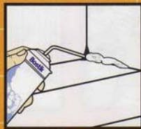
คอนกรีตแตก