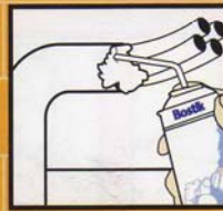
Pest + Vermin Proof