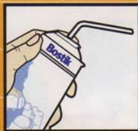
Bostik Expanda Foam