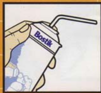
สเปรย์โฟม