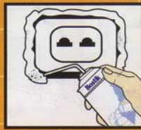
ปลั๊กไฟฝังผนัง