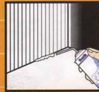
ห้องเย็น

บอสติก เอชแพนด้า โฟม ง่ายต่อการใช้งาน ขยายตัวและต่อเติม ช่องว่างในทุกที่ แม้บริเวณที่ยากต่อการเข้าถึง ช่วยลดฝุ่น เสียง ลมโกรก และป้องกัน การกัดทำลายของหนู และแมลงต่างๆ