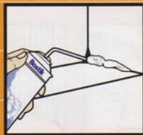
Fills Concrete Gaps